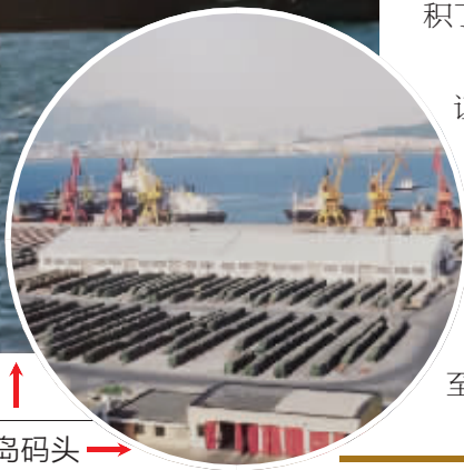
2000 年前的和尚岛码头 →