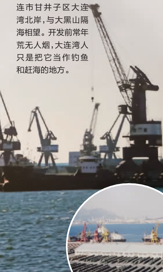
现在的和尚岛码头 ↑

和尚岛,位于大连市甘井子区大连湾北岸,与大黑山隔海相望。开发前常年荒无人烟,大连湾人只是把它当作钓鱼和赶海的地方。