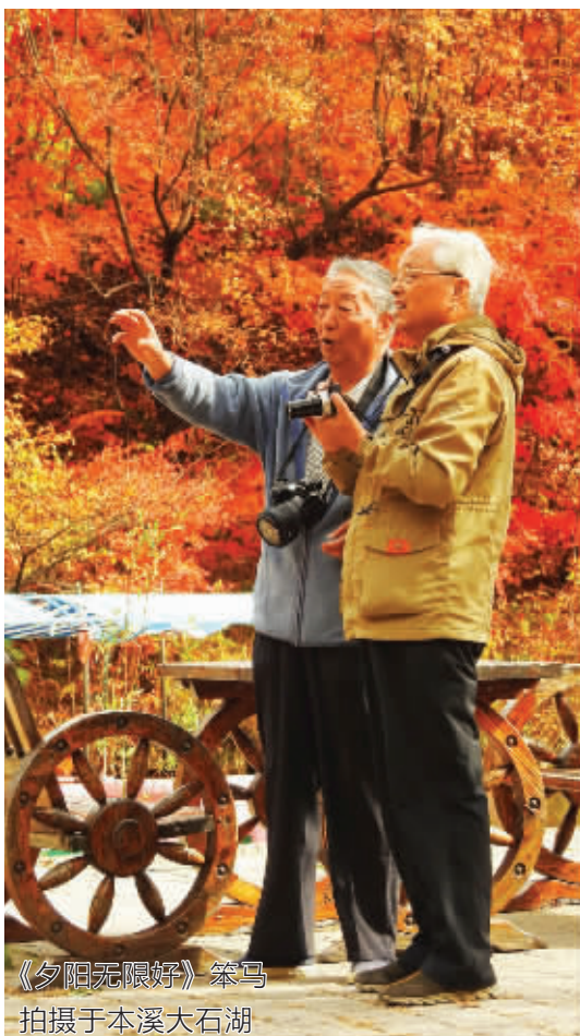
《夕阳无限好》笨马 拍摄于本溪大石湖