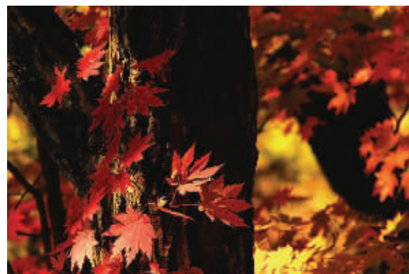
《枫叶正红》张凤林 ↑ 拍摄于抚顺清原筐子沟风景区