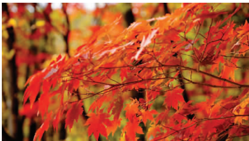
↑ 《绿树掩幽谷》余非欧 拍摄于辽宁桓仁满族自治县枫林谷景区