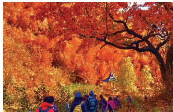
《驾游北行》解传江 ↑ 拍摄于丹东宽甸满族自治县天桥沟